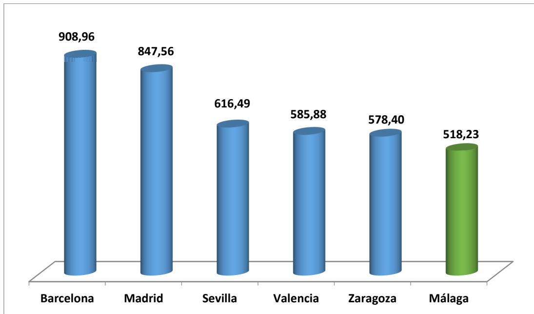
Gráfico 1: Ingresos tributarios 2022 (contribución fiscal absoluta). Euros por habitante Grandes ciudades

Si ampliamos la comparativa a todas las capitales de provincia españolas, Málaga presenta una contribución fiscal absoluta muy moderada, ocupando el puesto 44 de las 47 capitales con información a la fecha.